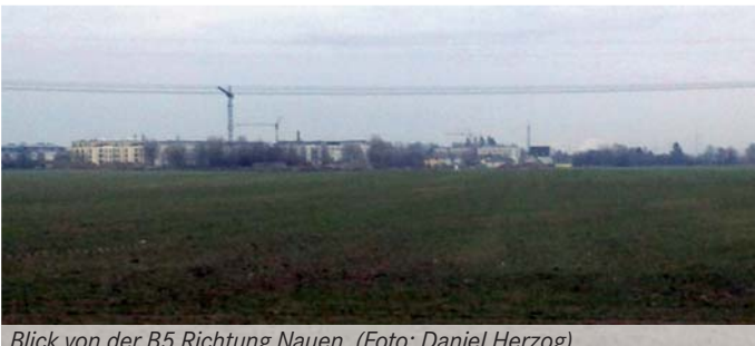
Blick von der B5 Richtung Nauen.