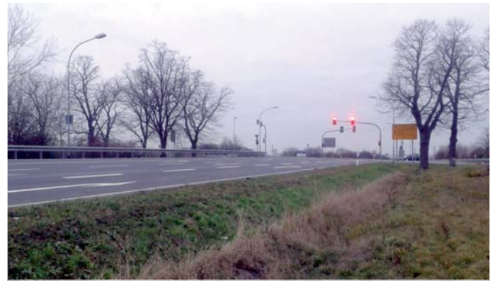
Die B5 bei Nauen.